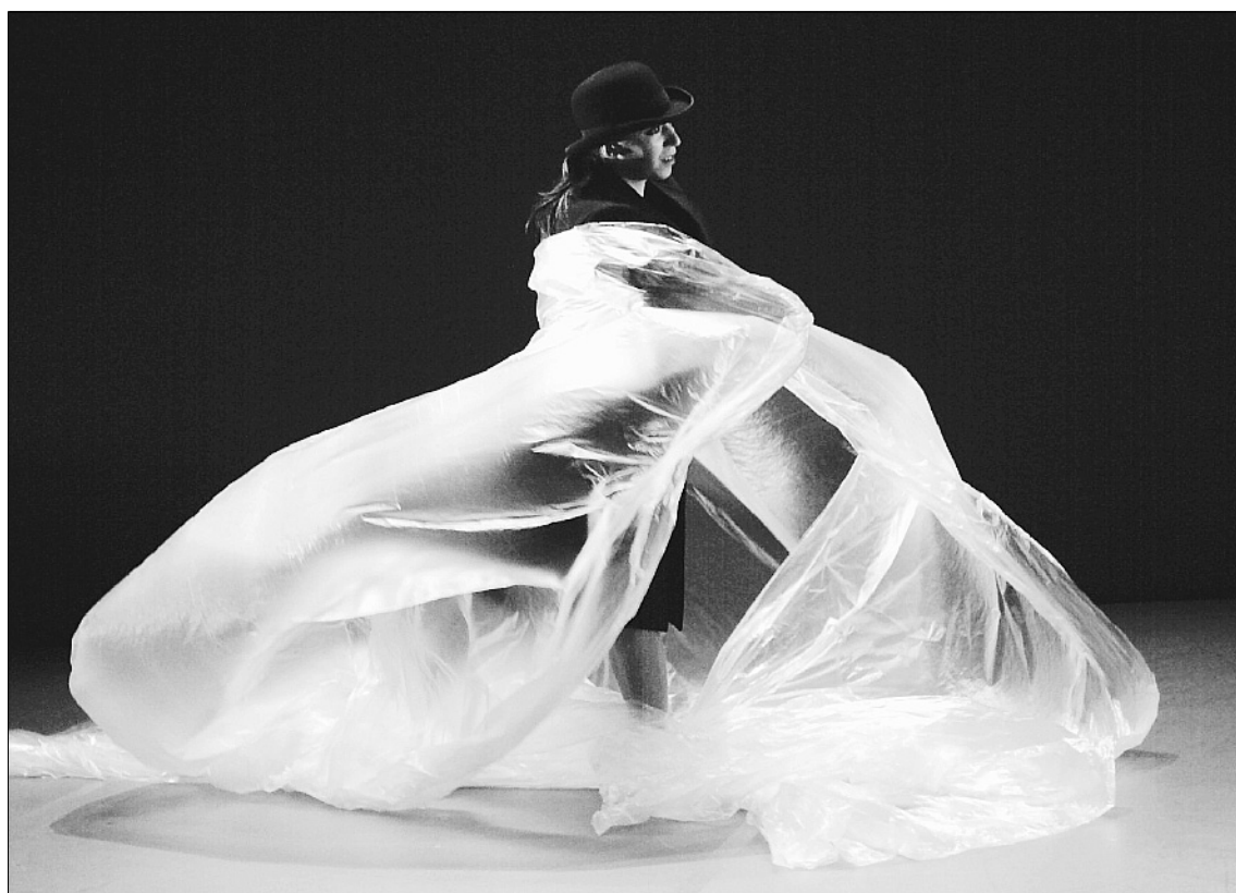
►► Un momento del espectáculo 'Nubes', de la compañía madrileña Aracaladanza.

La compañía del Príncipe Totilau y Tot Circ llevarán sus montajes al Centro de Cultura Antiguo Instituto y al Paseo de Begoña, respectivamente. Los primeros subirán al escenario gijonés La